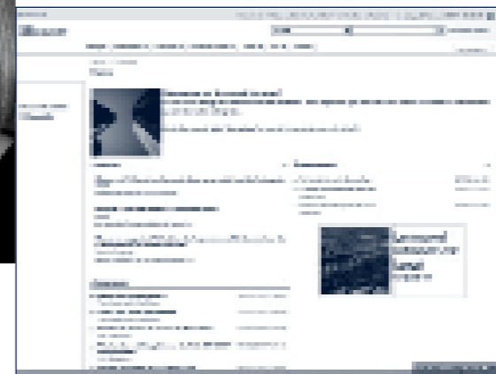
Le nouvel intranet permet à chaque collaborateur d'être alerté par mail sur les sujets qui l'intéressent